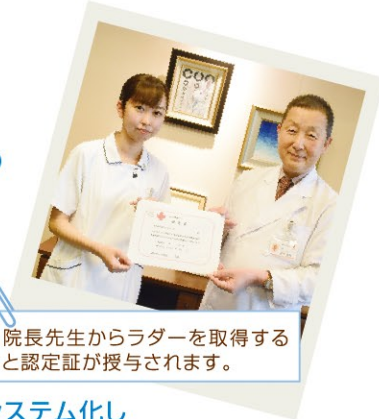
院長先生からラダーを取得すると認定証が授与されます。

赤十字病院独自の能力開発プログラム「キャリア開発ラダー」に則って教育計画をシステム化し、秦野赤十字病院が目指す看護師を育成します。